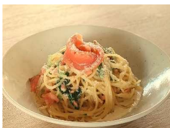
スモークサーモンの スパゲッティ <小麦・乳>