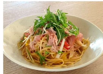
生ハムと彩り野菜の スパゲッティ - アンチョビ仕立て - <小麦・乳・卵>