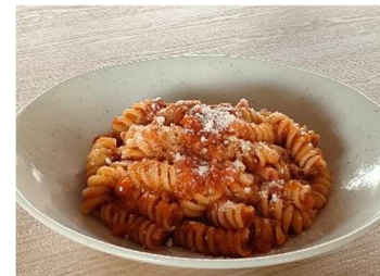
名物! 生クリームで仕上げる 知多牛ボロネーゼ - 生パスタ『フジリ』使用 - <小麦・乳・卵>