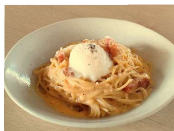
花井養鶏場の温玉添え 特製カルボナーラ <小麦・乳・卵>