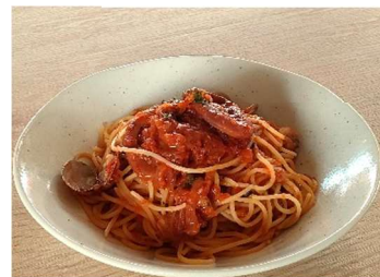
漁師風イカとアサリの スパゲッティ - 魚介の旨みたっぷり - <小麦>