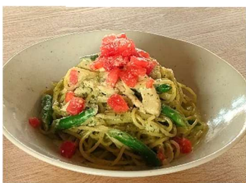
蒸し鶏とインゲン豆の バジルクリーム <小麦・乳>