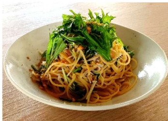
知多産水菜と国産シラスの ペペロンチーノ - からすみの香り - <小麦・乳・卵>