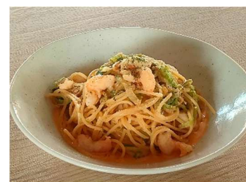
海老とレタスの ビスクリュー - 常滑牛乳を使用して - <小麦・乳・海老>