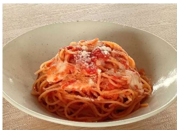
モッツアレラチーズの入った シンプルなトマトソース <小麦・乳>