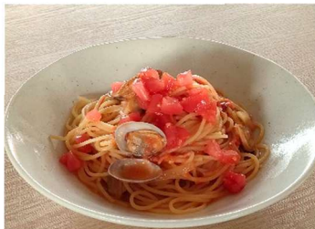
アサリとフレッシュトマトの スパゲッティ - 国産バター風味で - <小麦・乳・卵>