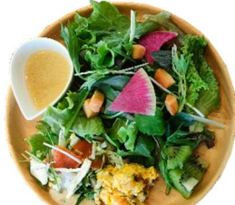
サラダ & デリ2品