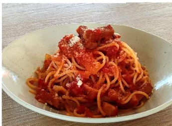
アマトリチャーナ ゴロゴロベーコンと たっぷり玉葱トマトソース <小麦・乳・卵>