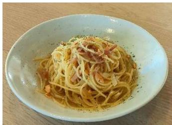
SUKUSUKU 風 ペペロンチーノ - ベーコンと玉ねぎの旨み - <小麦・乳・卵>